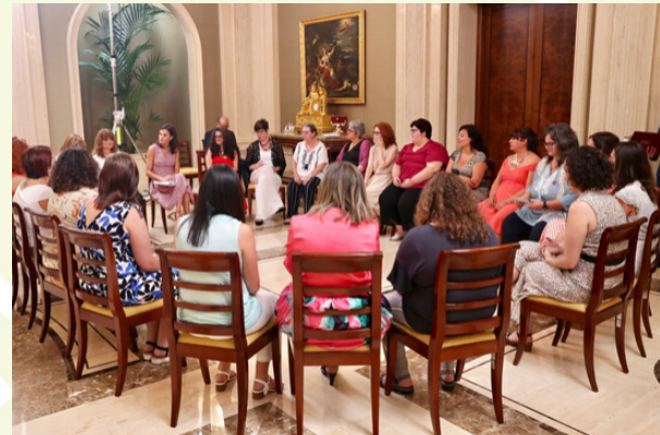
Encuentro con SM la Reina Doña Letizia

En la actualidad estamos presentes en Comité Gallego y en la Red de Mujeres y Salud Mental y tenemos un Comité audiovisual con tres cortos en su haber( "Se vende", "Botemos o estigma o lixo y Conect@ coa vida")